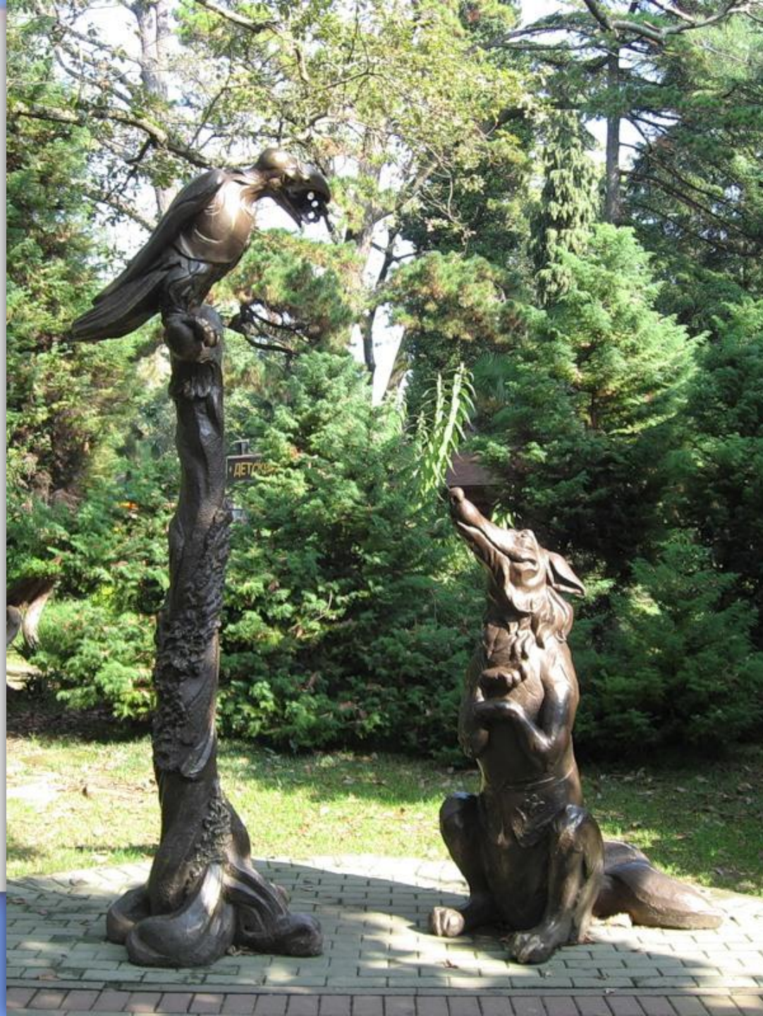
Памятник Вороне и