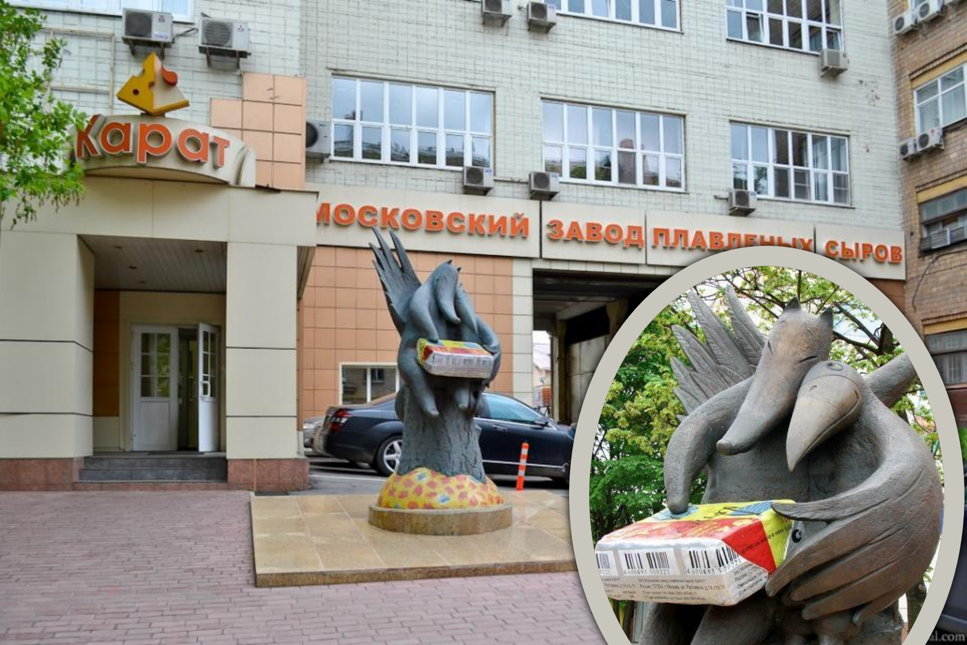
Памятник плавленому сырку «Дружба»