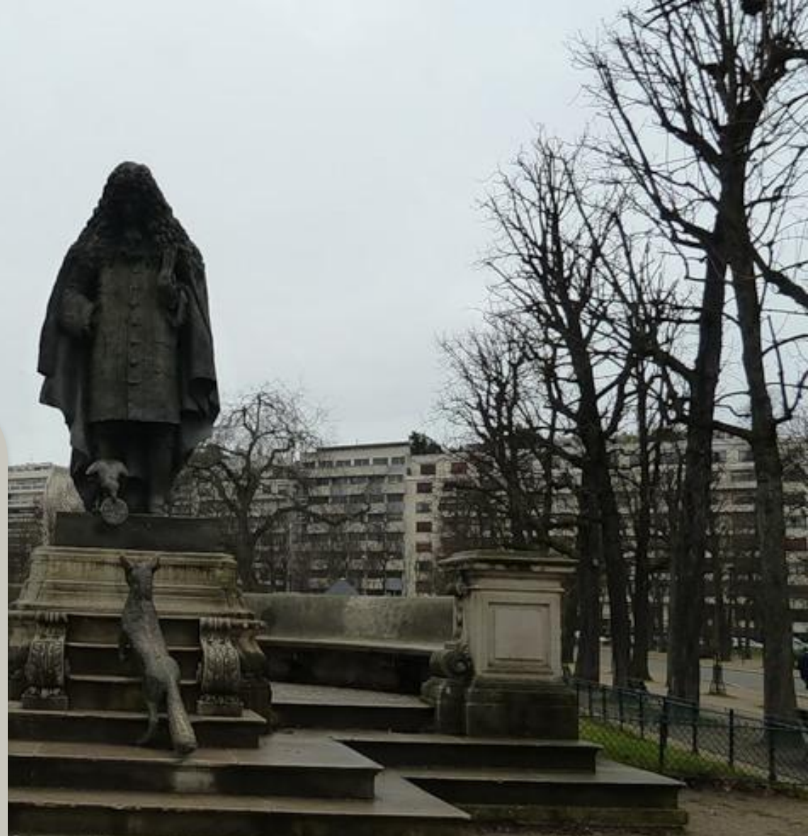
Памятник Жану Лафонтену в Париже с героями переложенной им на