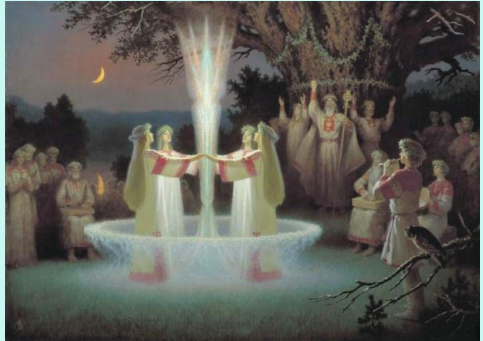
Борис Ольшанский. Ночь на Ивана Купалу

Купальские обряды состоят из сбора трав и цветов, плетения венков, украшения зеленью построек, разжигания костров, уничтожения чучела, перепрыгивания через костер или через букеты зелени, обливания водой, плетения