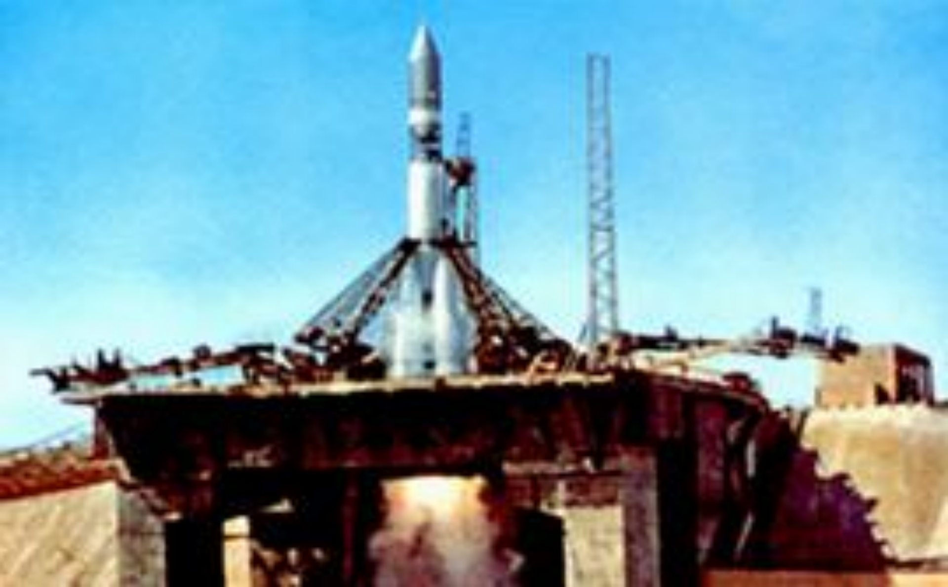
Первый космический корабль «Восток»