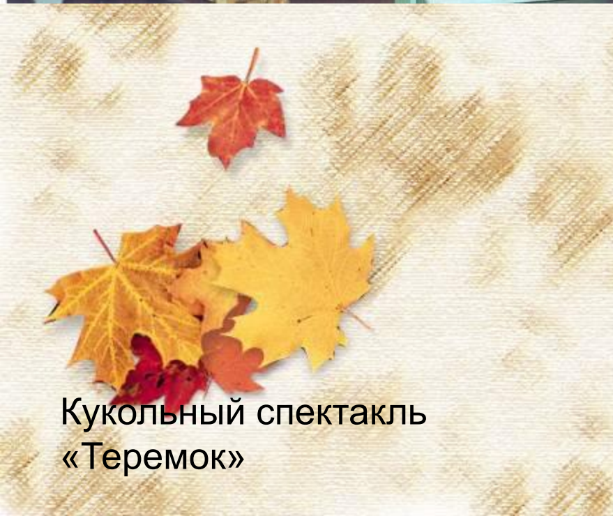
Кукольный спектакль «Теремок»