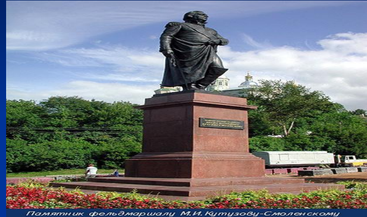
Памятник фельдмаршалу М.И. Кутузову-Смоленскому