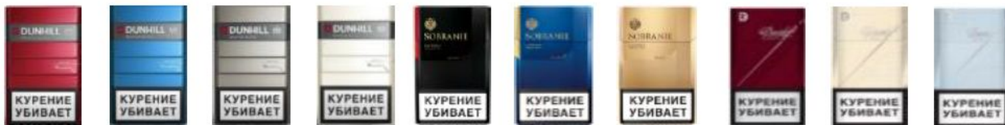
Dunhill Fine Cut (White) Dunhill Fine Cut (White) Dunhill Fine Cut (White) Dunhill Fine Cut (White) Sobranie London Black Sobranie London Blue Sobranie London Gold Davidoff Classic Davidoff Gold Davidoff Blue