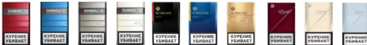
Dunhill Fine Cut (White) Dunhill Fine Cut (White) Dunhill Fine Cut (White) Dunhill Fine Cut (White) Sobranie London Black Sobranie London Blue Sobranie London Gold Davidoff Classic Davidoff Gold Davidoff Blue