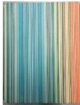
Чехол для iPad

Пластиковый презентор-пенал для демонстрации разницы между удлиненным фильтром-мундштуком и обычным фильтром (сравнение сигареты P Line и сигареты CK)