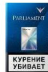
Parliament Reserve KS

* ЛОЯЛЬНЫХ СОВЕРШЕННОЛЕТНИХ ПОТРЕБИТЕЛЕЙ PARLIAMENT НЕ ПЕРЕКЛЮЧАЕМ НА P LINE!!!