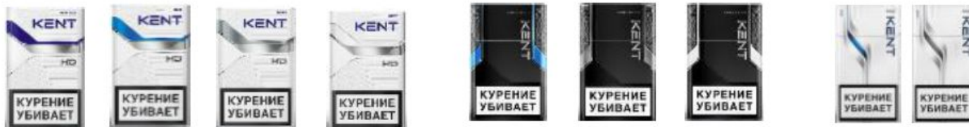
Kent HD Navy Blue Kent HD Blue Kent HD Silver Kent HD White Kent Nanotek 2.0 Blue Kent Nanotek 2.0 Silver Kent Nanotek 2.0 White Kent HD Blue Kent HD Silver