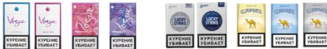
Vogue Bleu Vogue Lilas Vogue Arome Balade Au Parc Vogue Arome Jard.S.La Neige Lucky strike Camel family