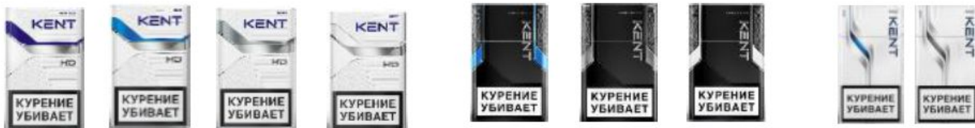
Kent HD Navy Blue Kent HD Blue Kent HD Silver Kent HD White Kent Nanotek 2.0 Blue Kent Nanotek 2.0 Silver Kent Nanotek 2.0 White Kent HD Blue Kent HD Silver