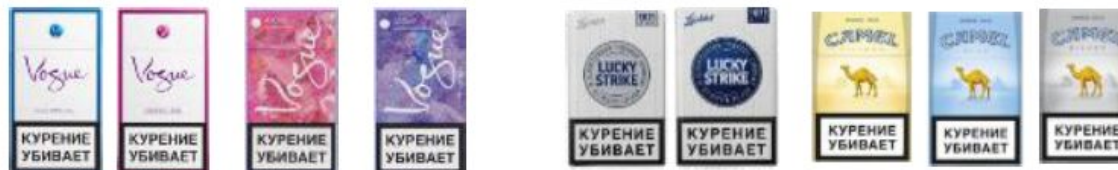
Vogue Bleu Vogue Lilas Vogue Arome Balade Au Parc Vogue Arome Jard.S.La Neige Lucky strike Camel family