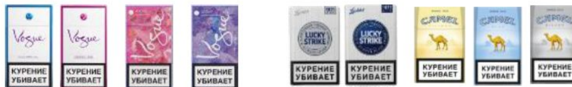
Vogue Bleu Vogue Lilas Vogue Arome Balade Au Parc Vogue Arome Jard.S.La Neige