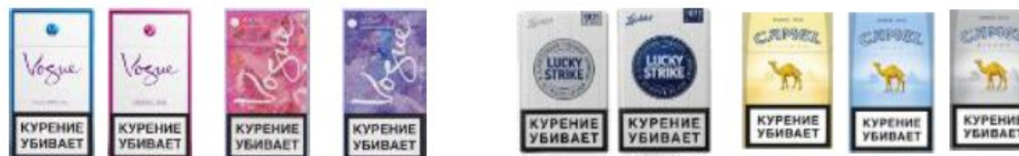
Vogue Bleu Vogue Lilas Vogue Arome Balade Au Parc Vogue Arome Jard.S.La Neige