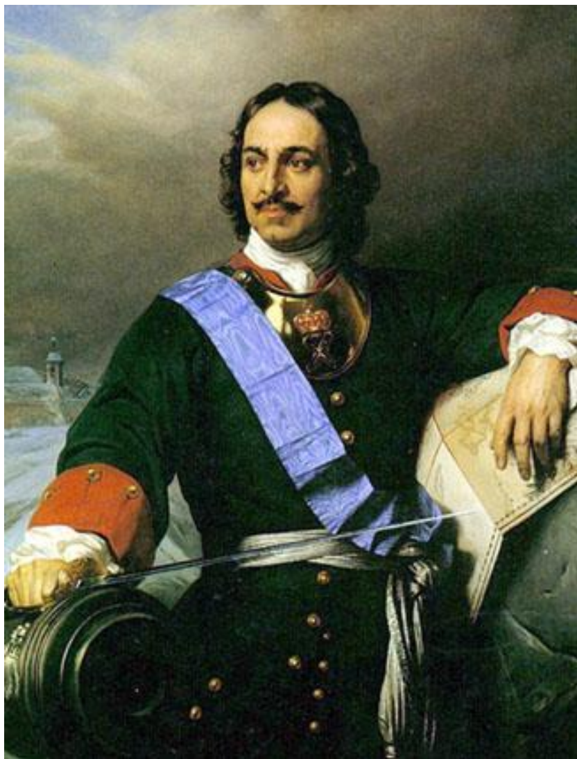
Петр I – первый русский флотоводец