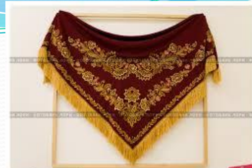
Вышитый узором эмальский платон