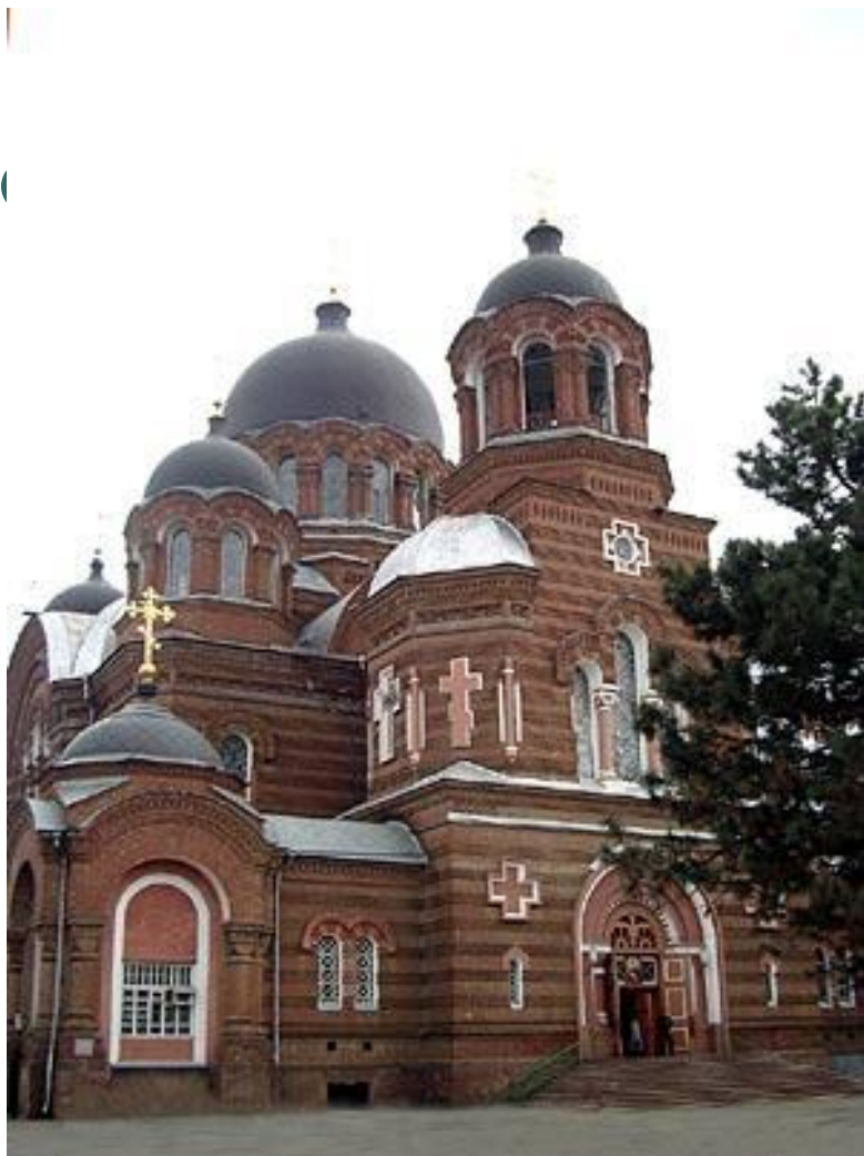
Собор св. Екатерины (архитектор И. К. Мальгерб