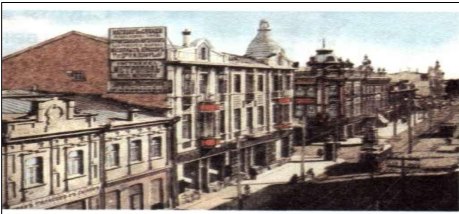
Первый трамвай на ул. Красной

В нём было: 250 магазинов, 80 заводов, 8 церквей, 1 собор, 3 типографии. В городе появились водопровод, электричество, телефон, а 10 декабря 1900 года побежал по рельсам первый трамвай.