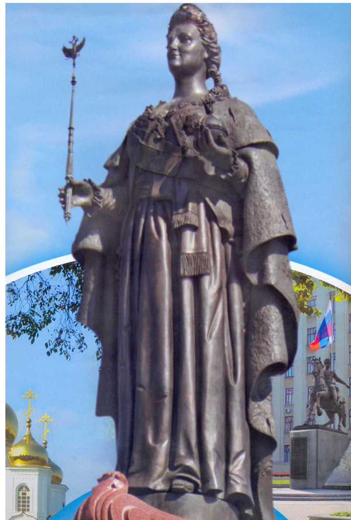
Памятник Екатерине Великой. 1907 г. Скульптор М. О. Микешин. Достраивал Б. В. Эдуардс.