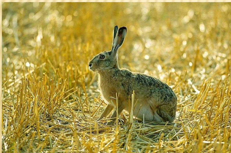
Заяц русак – Lepus caproaucus