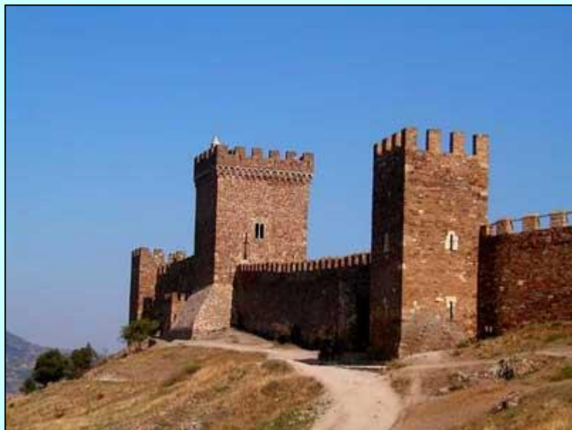
Генуэзская крепость в Судаке

3. В Древней Руси для обороны города внутри строили крепость, а внутри крепости сооружали последнее убежище защитников при штурме, которое называлось цитадель. У греков – это был акрополь, у римлян – Капитолий, а у русских это название было образовано от слова «кром». Назовите его современное звучание, если этим сооружением мы любимся до сих пор.