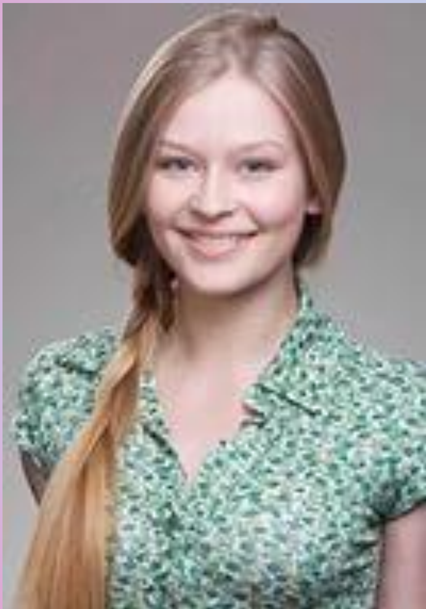
Юлия Пересильд - актриса