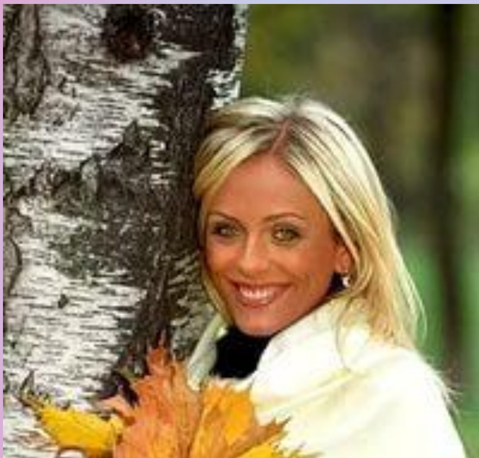
Юлия Началова - певица