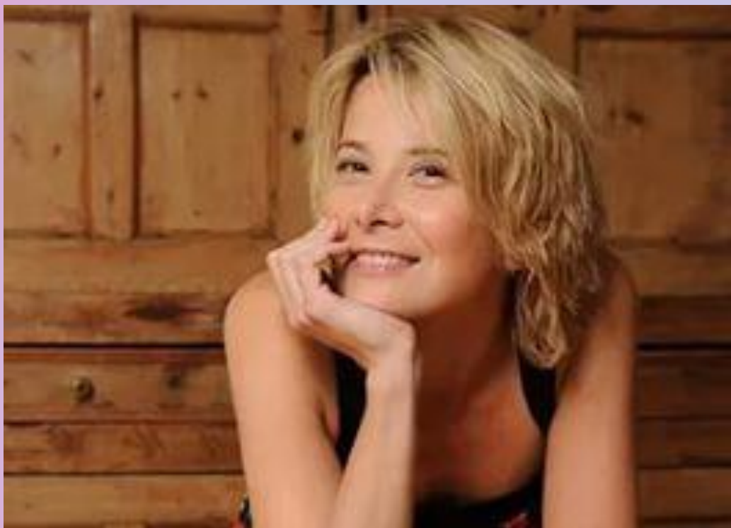
Юлия Высоцкая – актриса, телеведущая