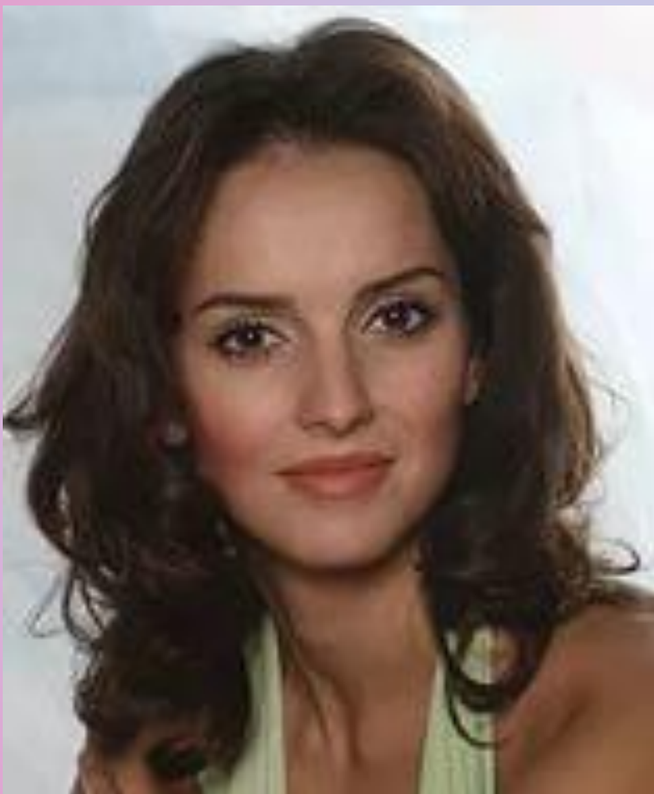
Юлия Зимина - телеведущая