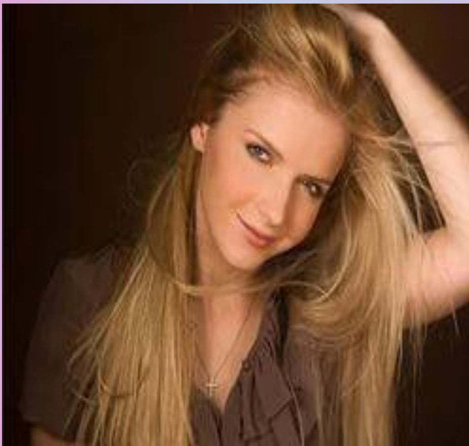
Юлия Михальчик - певица