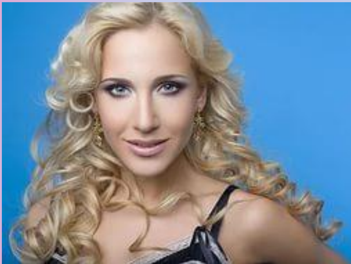
Юлия Ковальчук - певица