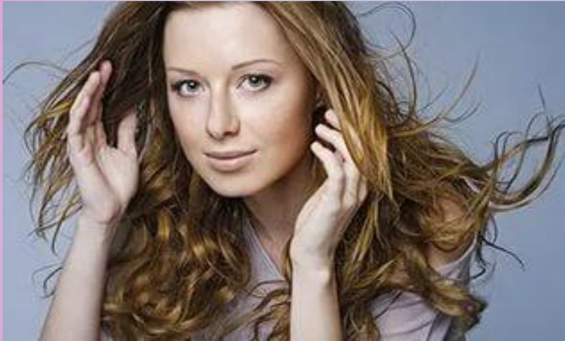
Юлия Савичева - певица