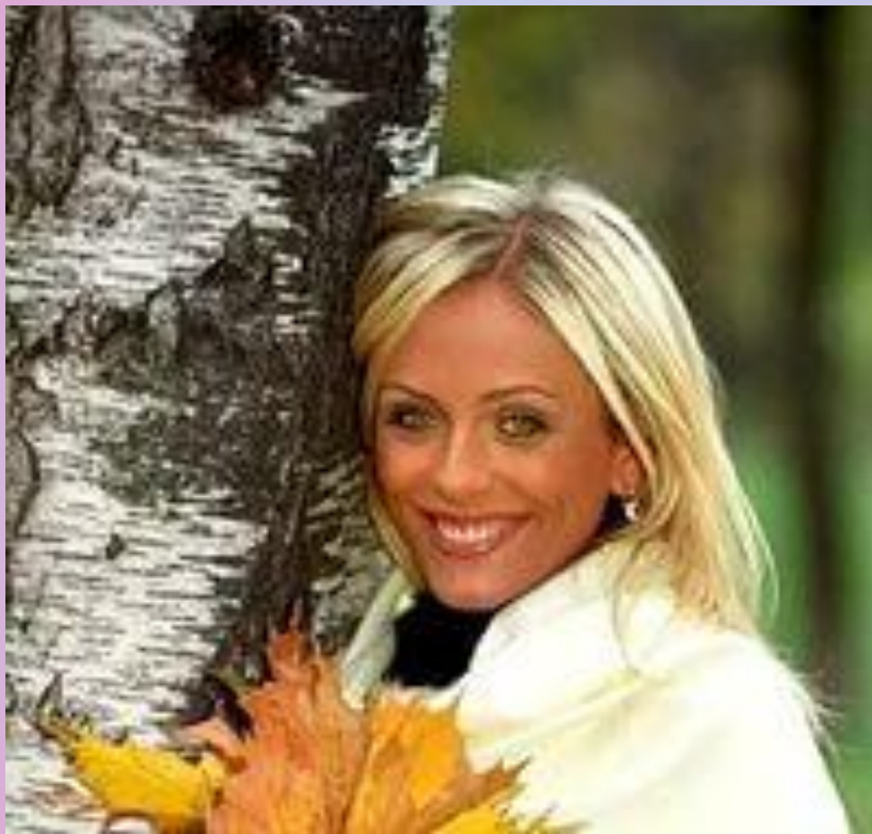
Юлия Началова - певица