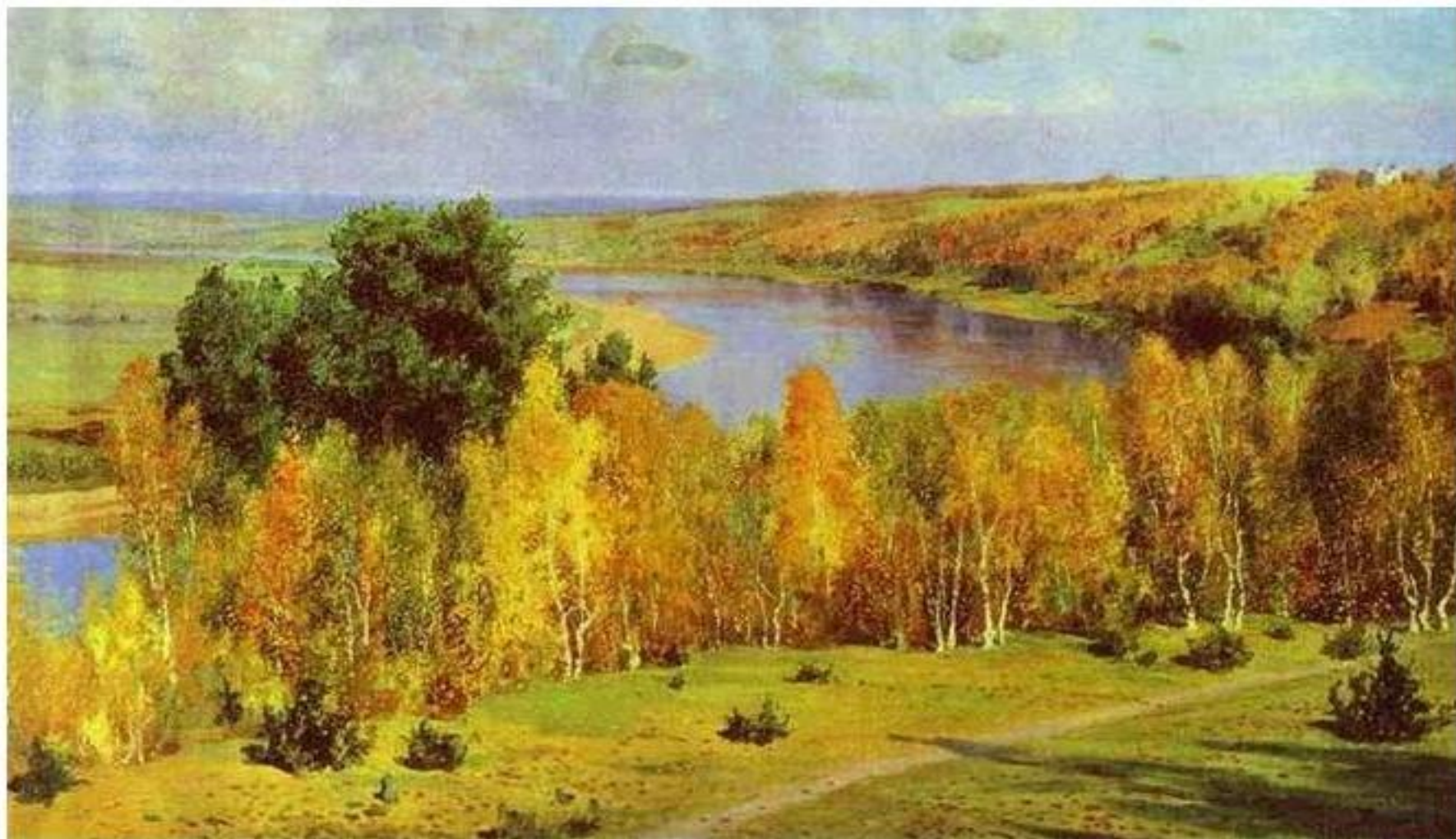
Золотая осень. Василий Поленов