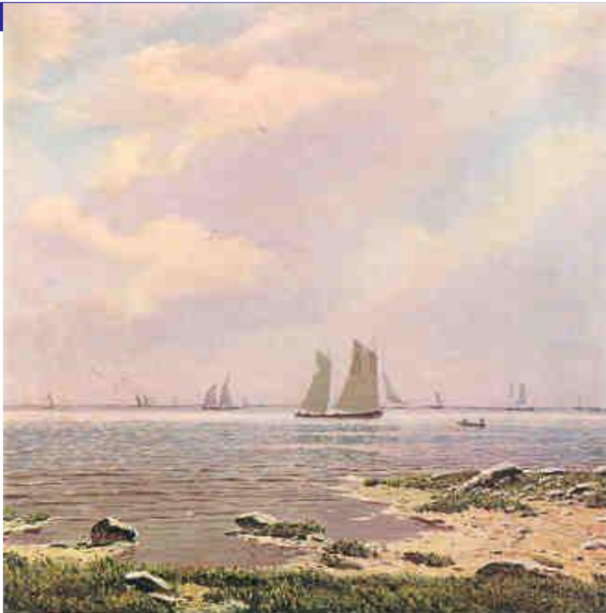
Н.Н. Дубовский. Море.