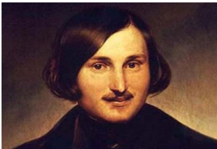
Николай Васильевич Гоголь