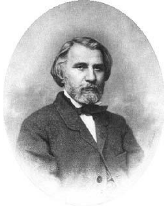
Иван Сергеевич Тургенев