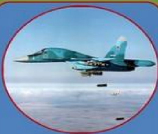
Военно- воздушные силы