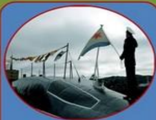
Военно- морской флот