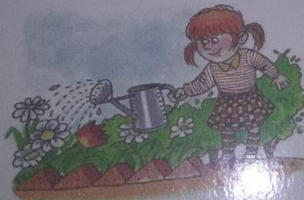
ЗИНА ЛЬЕТ ВОДУ.