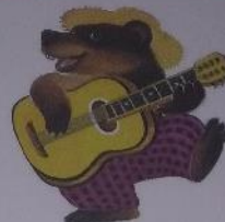
МЕДВЕДЬ РЫЧИТ: «Э-Э-Э!»