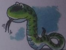
ЗМЕЯ ШИПИТ: «Ш-Ш-Ш».