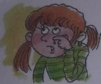
ДЕВОЧКА ПЛАЧЕТ: «А-А-А!»

Вместе с малышом рассмотрите картинки и попросите его: «Покажи, где девочка плачет». В случае затруднения укажите пальчиком ребенка на нужную картинку: «Вот девочка. Девочка плачет: «А-А-А». Девочка плачет долго: «А-А-А». Потяните долго звук «А». Даже если ребенок не сможет с первого раза произнести звук, обязательно похвалите его: «Да, молодец, «А-А-А». Возвращайтесь к упражнению с мамой, папой, бабушкой и малышом, глядя на вашу артикуляцию, научитесь повторять эти звуки.