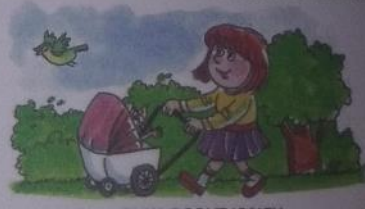
ВИКА ВОДИТ КОЛЕСУ.