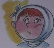
У МАЛЬЧИКА БОЛИТ ЗУБ: «О-О-О!»