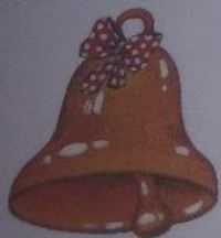
КОЛОКОЛЬЧИК ЗВЕНИТ: И-И-И!