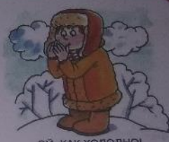
ОЙ, КАК ХОЛОДНО! ПОГРЕЙ РУЧКИ: «Х-Х-Х».