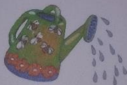
ВОДИЧКА ЛЬЕТСЯ: С-С-С.