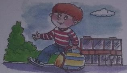
ВИТЯ НЕСЕТ СУМКУ.