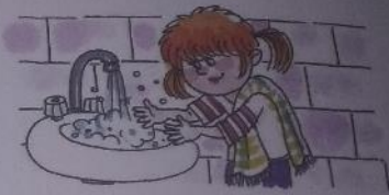
ДАША МОЕТ РУКИ.