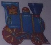
ПАРОВОЗИК ГУДИТ: У-У-У!