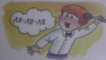
КОСТЯ ПОЕТ: «ЛЯ-ЛЯ-ЛЯ».