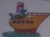
ПАРОВОД ПЛЫВЕТ: Ы-Ы-Ы.