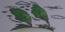
ВЕТЕР ДУЕТ: В-В-В.