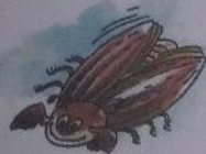
ЖУК ЖУЖЖИТ: «Ж-Ж-Ж».