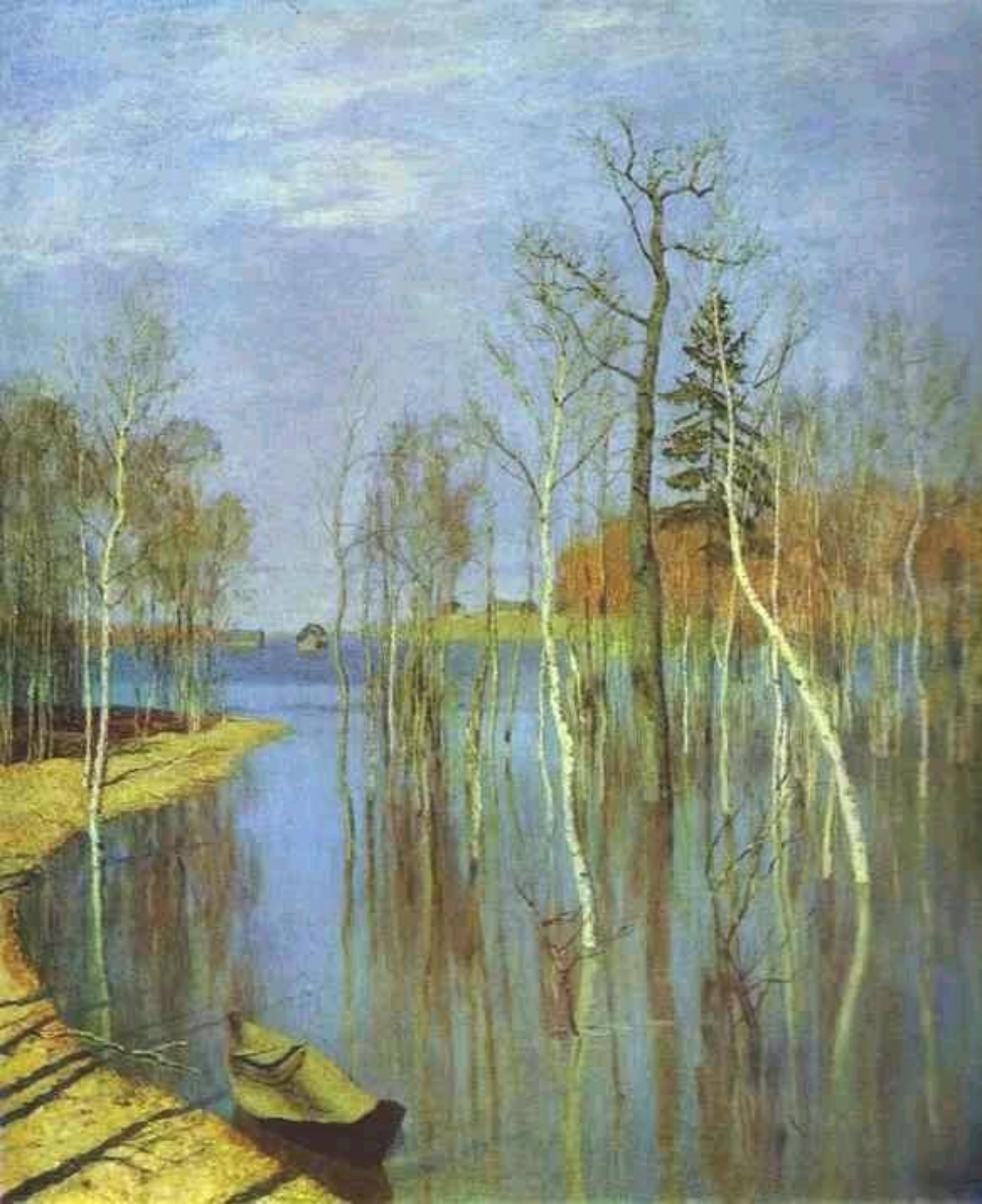
И.Левитан. Большая вода.