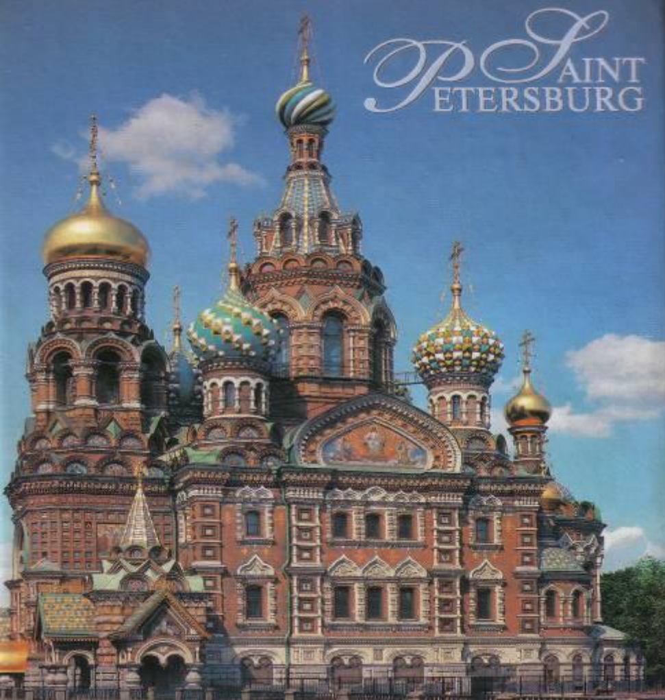
Храм Спаса на крови