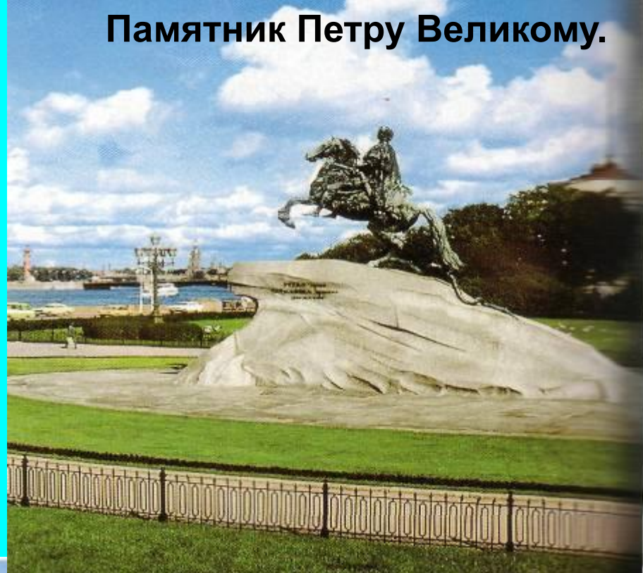
Памятник Петру Великому.