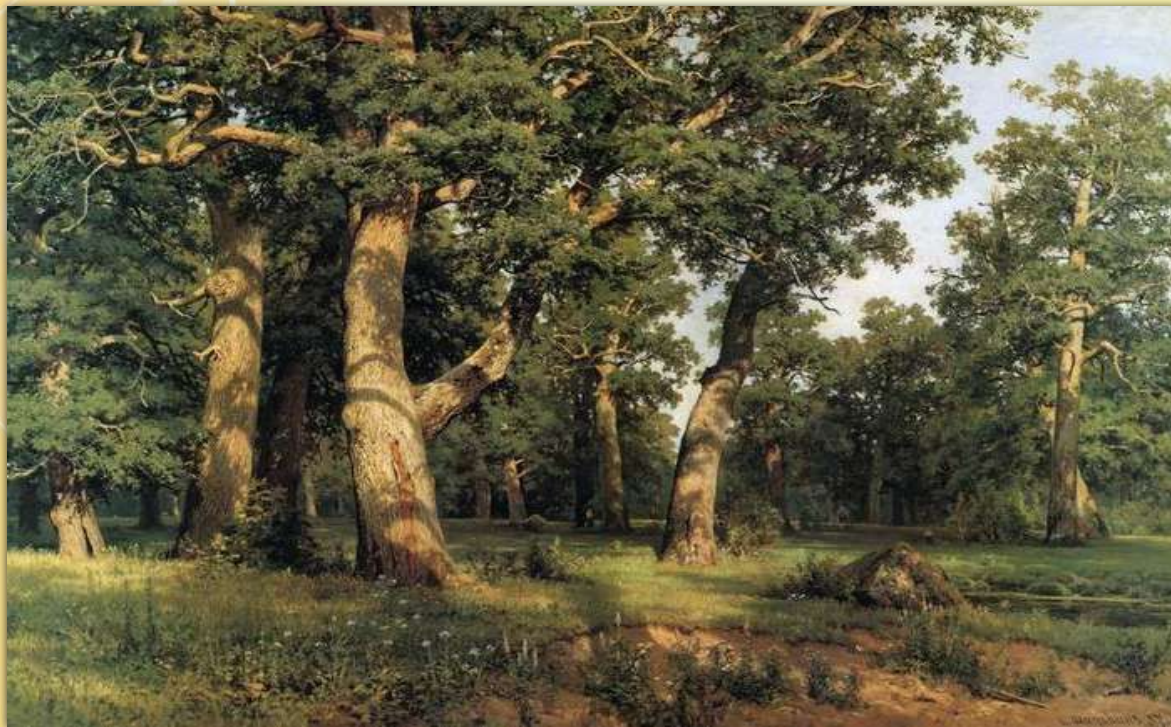
Дубовая роща. 1887. И.И.Шишкин.

Репродукция – картина, воспроизведенная в книге, альбоме, учебнике.