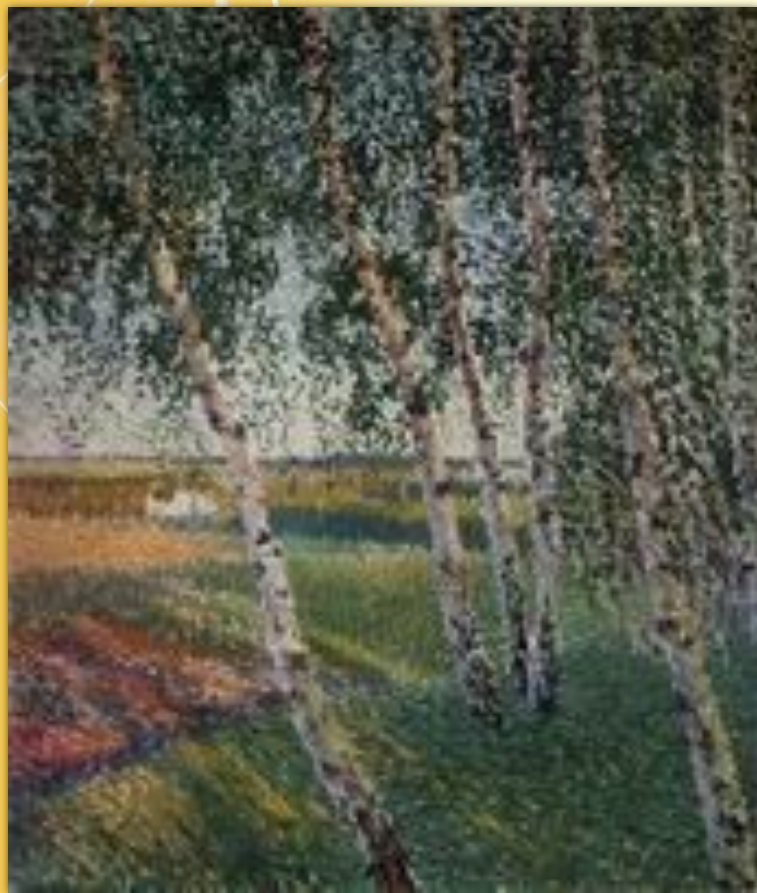
Майский вечер. 1905