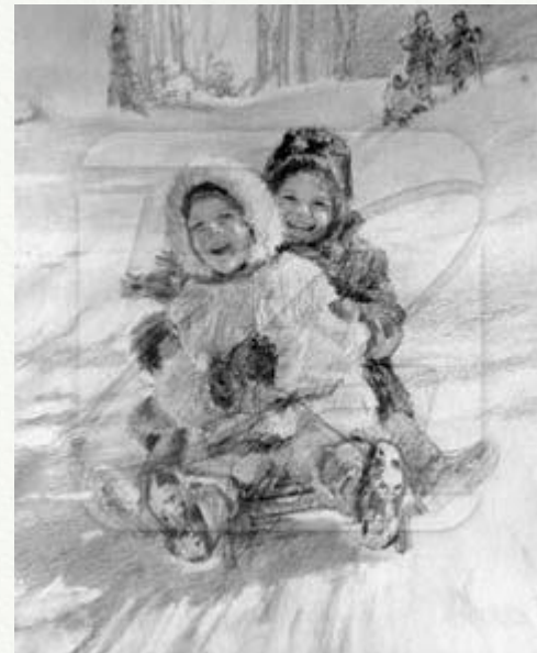
В. Жуков. Дайте дорогу