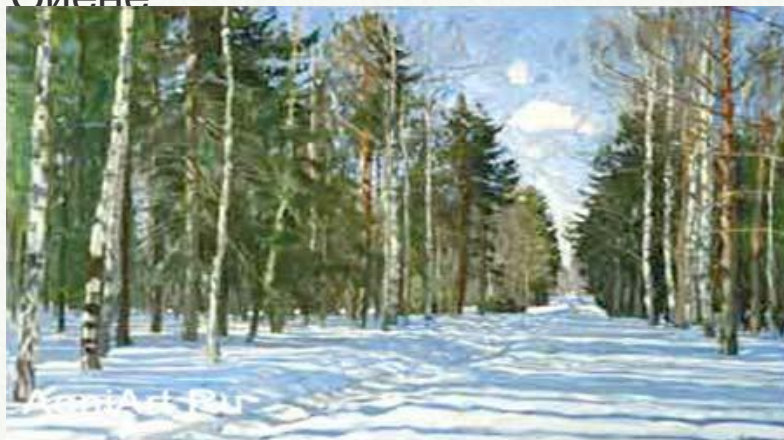
С. Жуковский. Лесная дорога