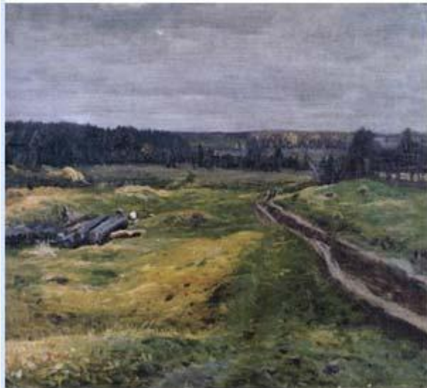
П. Кончаловский. Дорога в Сиене