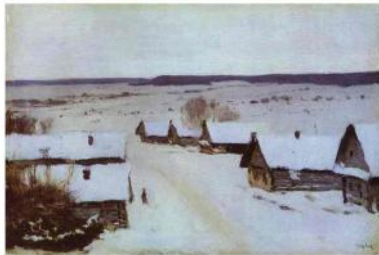
Деревня зимой. Исаак Левитан