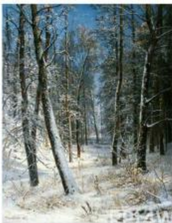
Зима в лесу. Иней. И.И.Шишкин