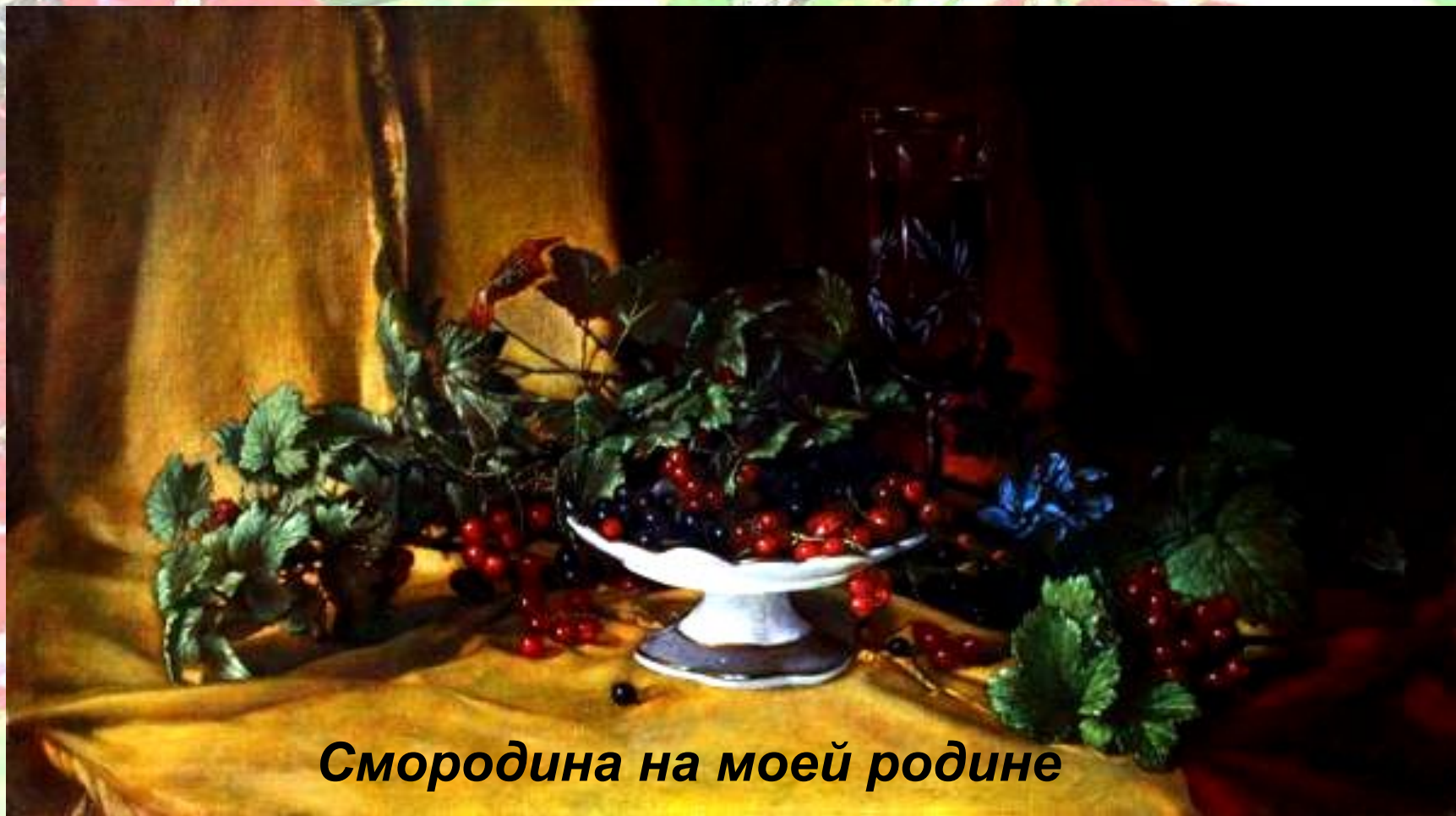
Смородина на моей родине