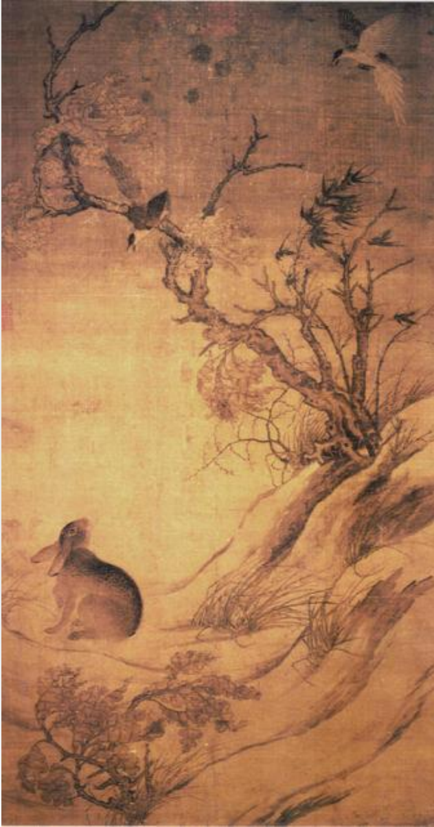
Цуй Бо «Сороки и заяц» год написания 1061