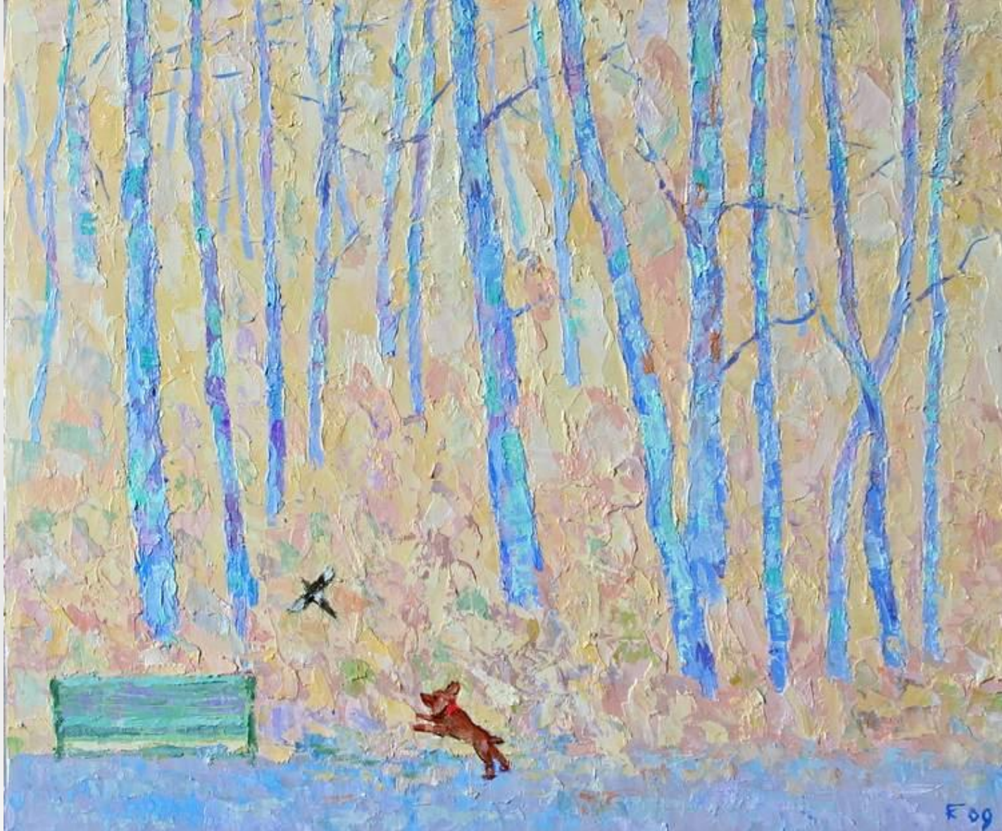
Li Anshong «Сорока и собака»