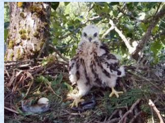
Ястреб на самой вершине дерева