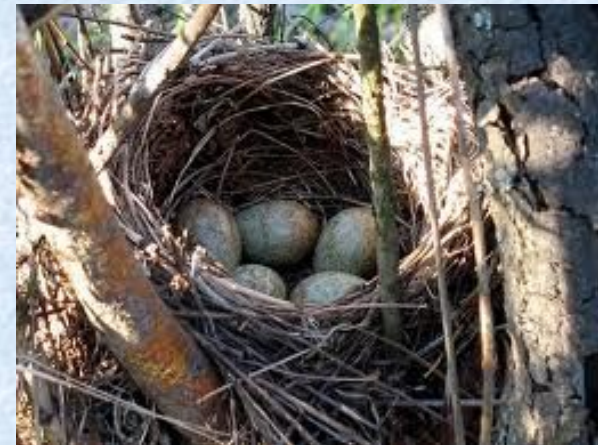
Дрозд в кустах