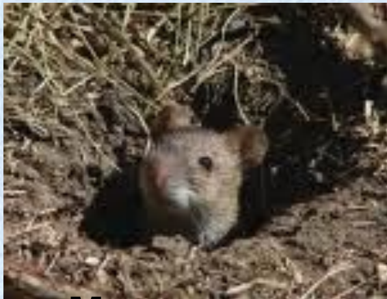
Мышка в норке