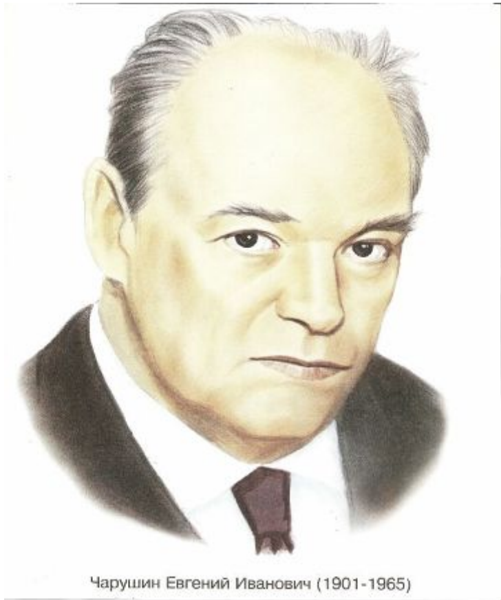
Чарушин Евгений Иванович (1901-1965)