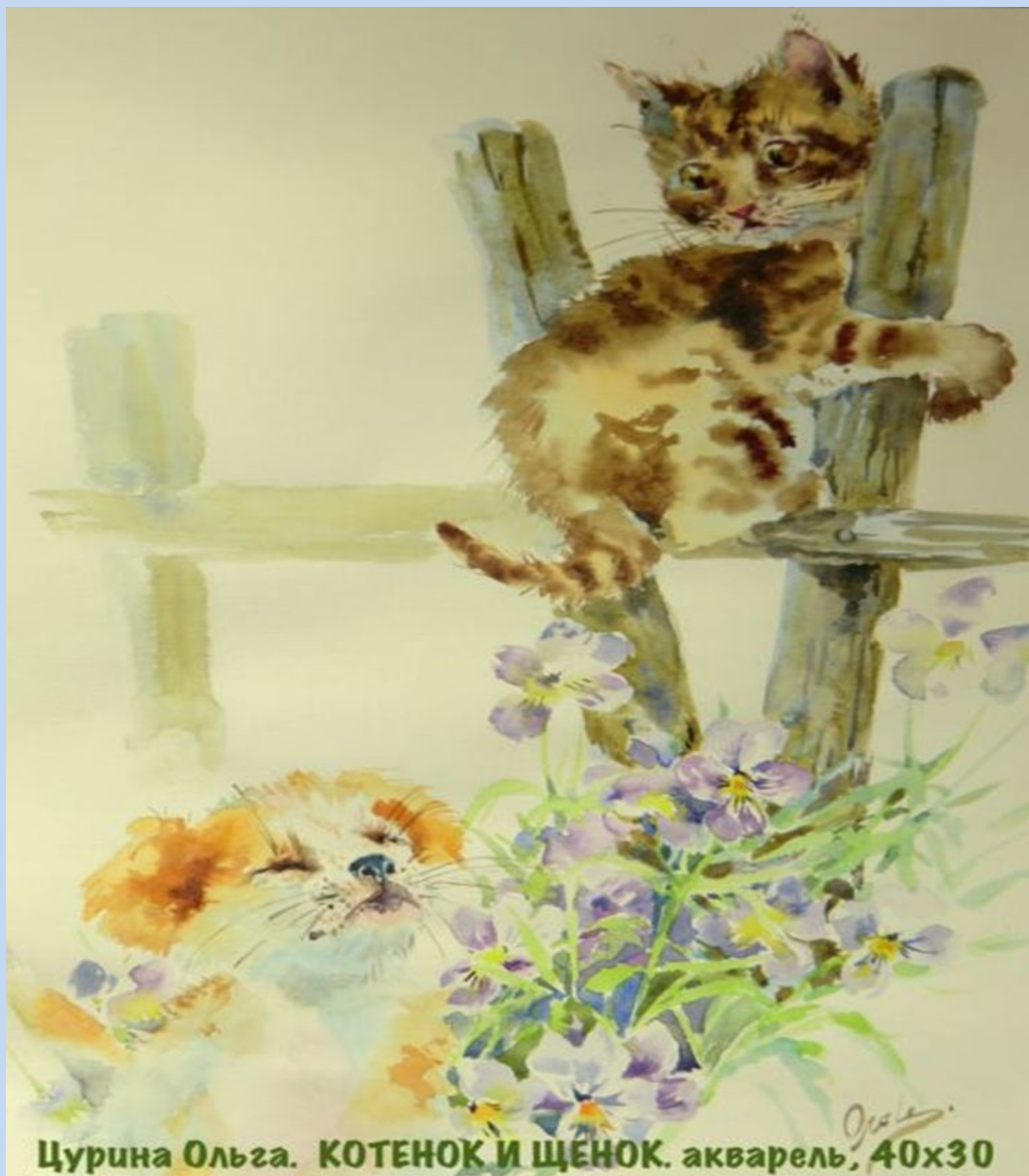
Цурина Ольга. КОТЕНОК И ЩЕНОК. акварель, 40x30