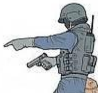
ТАМ / ТУДА