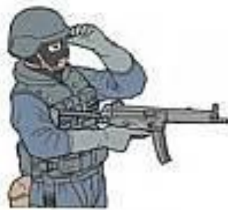
СМОТРИ / Я ВИЖУ