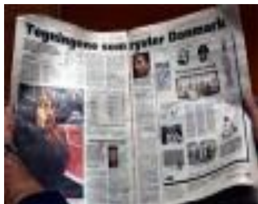
Средства массовой информации