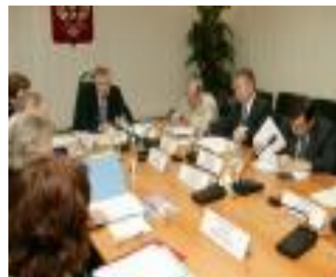
Официальная сфера, законодательство