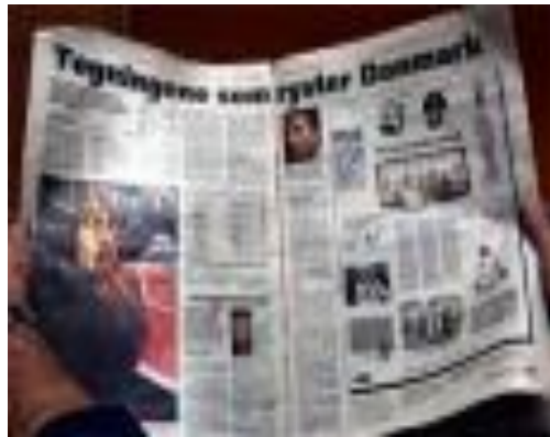
Средства массовой информации