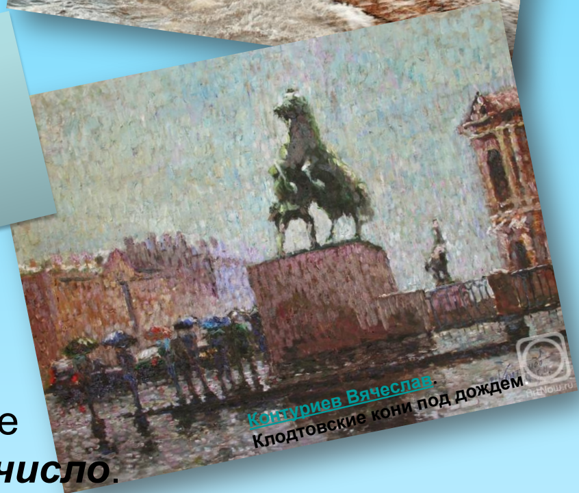
Конгуриев Вячеслав Клодтовские кони под дождем

Ну и ветер жмёт с залива! Дождик хлещет всё сильнее, И насквозь промокли гривы Старых клодтовских коней.