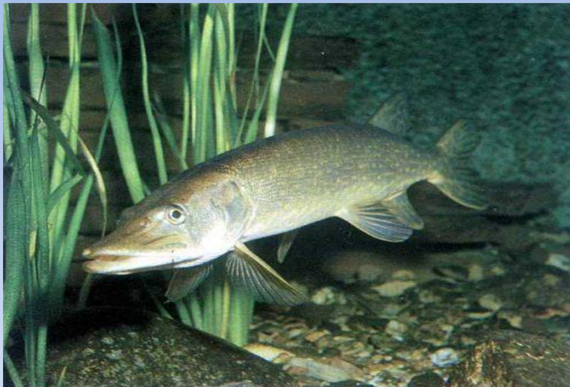
Щука - Esox lucius