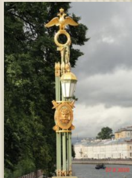
Мост Ломоносова Пантелеймоновский