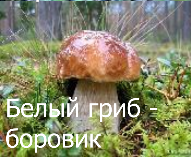
Белый гриб - боровик