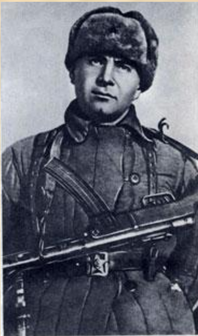
Герой Советского Союза Ц. Л. Куников в дни боёв под Новороссийском (1943 год).