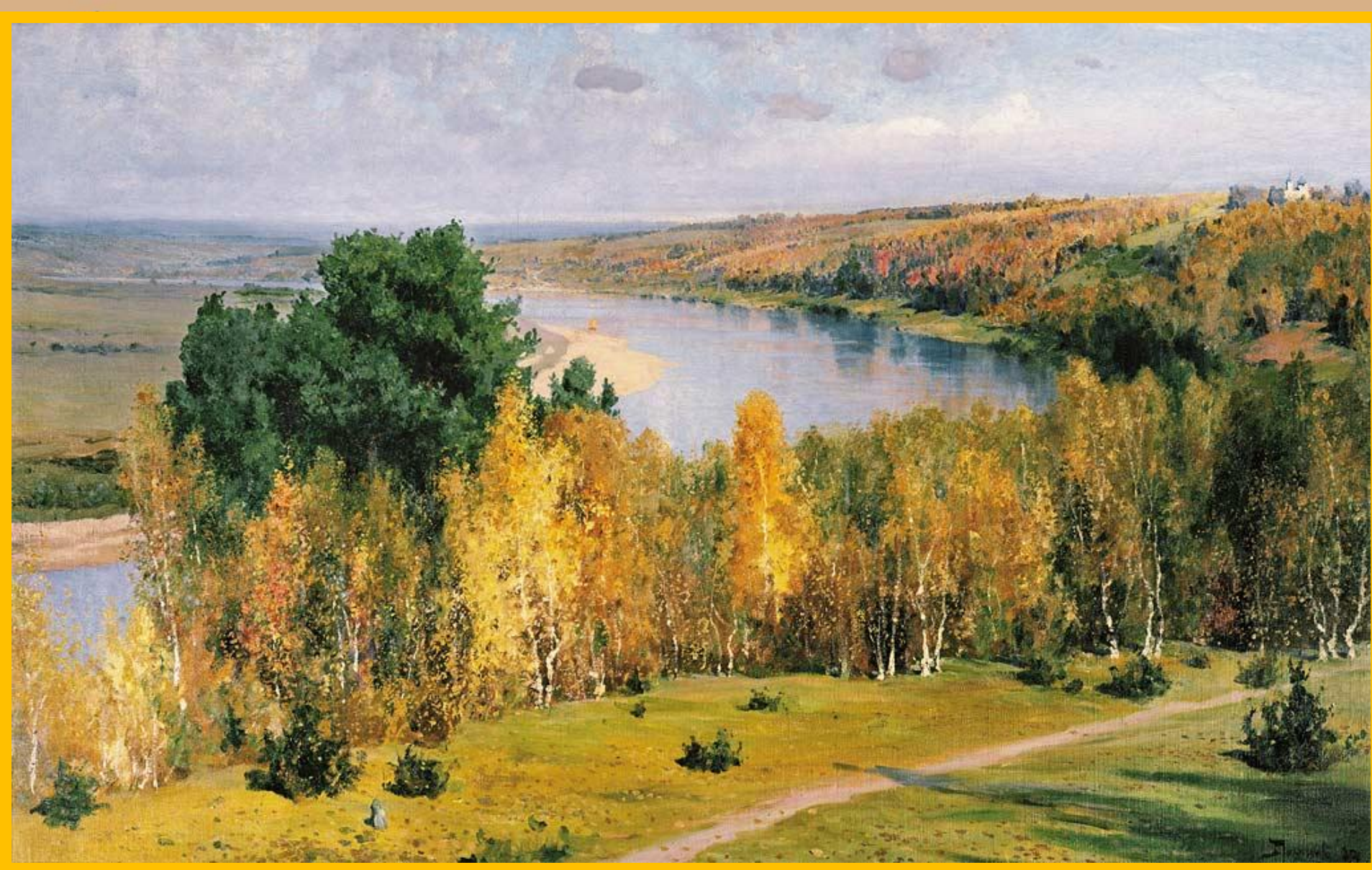
Василий Поленов. Золотая осень. 1893г.