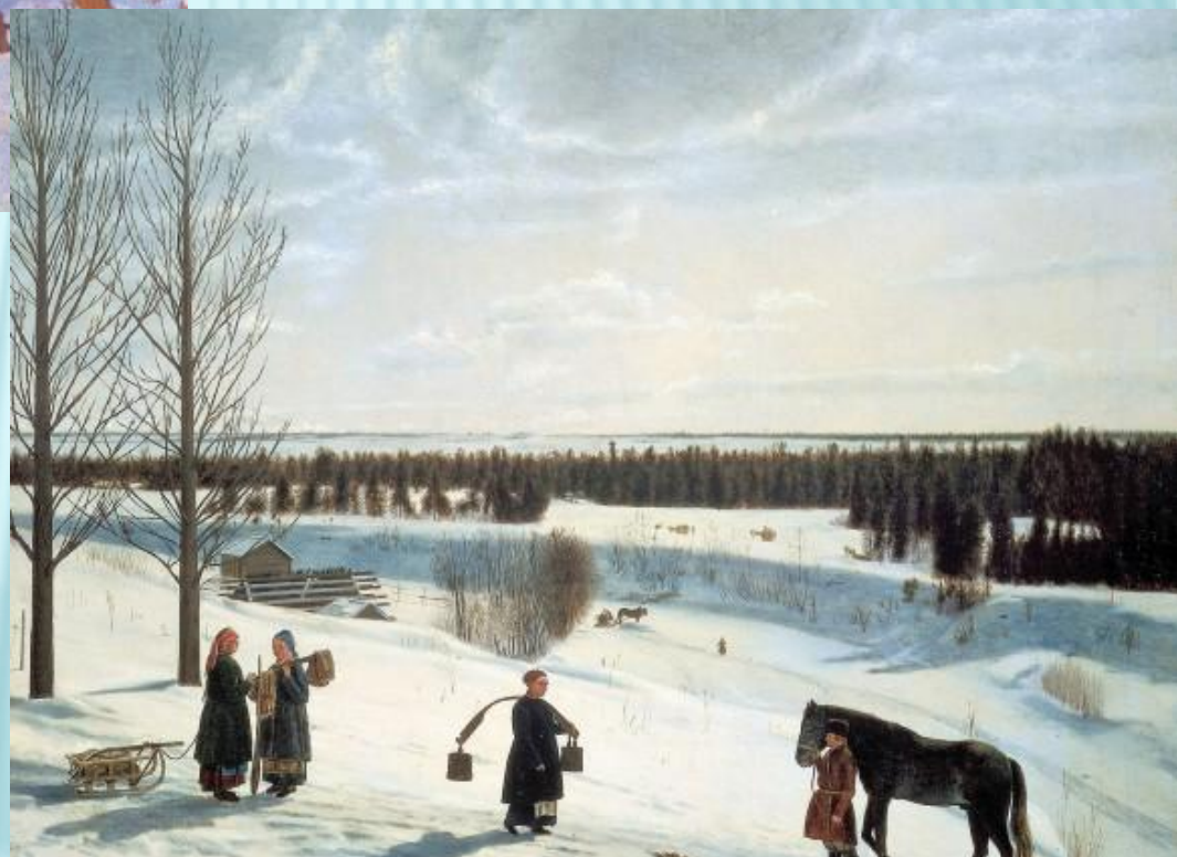
К.Юон «Мартовское солнце»