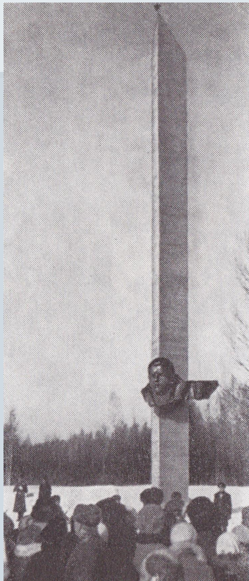
Обелиск у д.Чернушки на месте подвига А.Матросова. Сооружён в 1978 году.