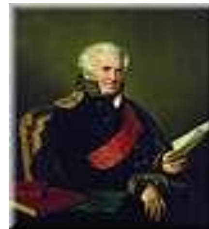
А. С. Шишков