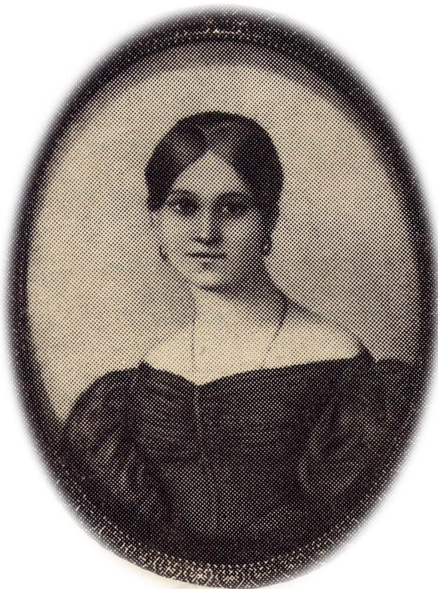
Анна Петровна Керн