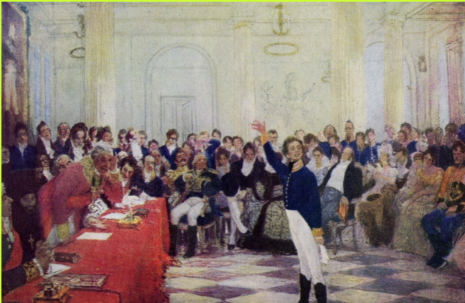
Публичный экзамен в Лицее на картине И.Е.Репина