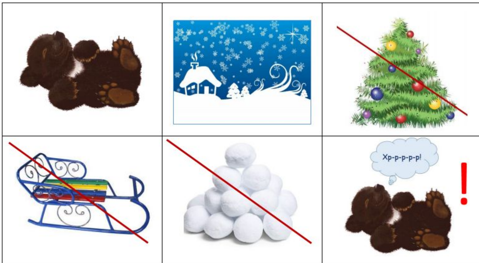
Мнемотаблица к стихотворению «Мишка, мишка, лежебока»