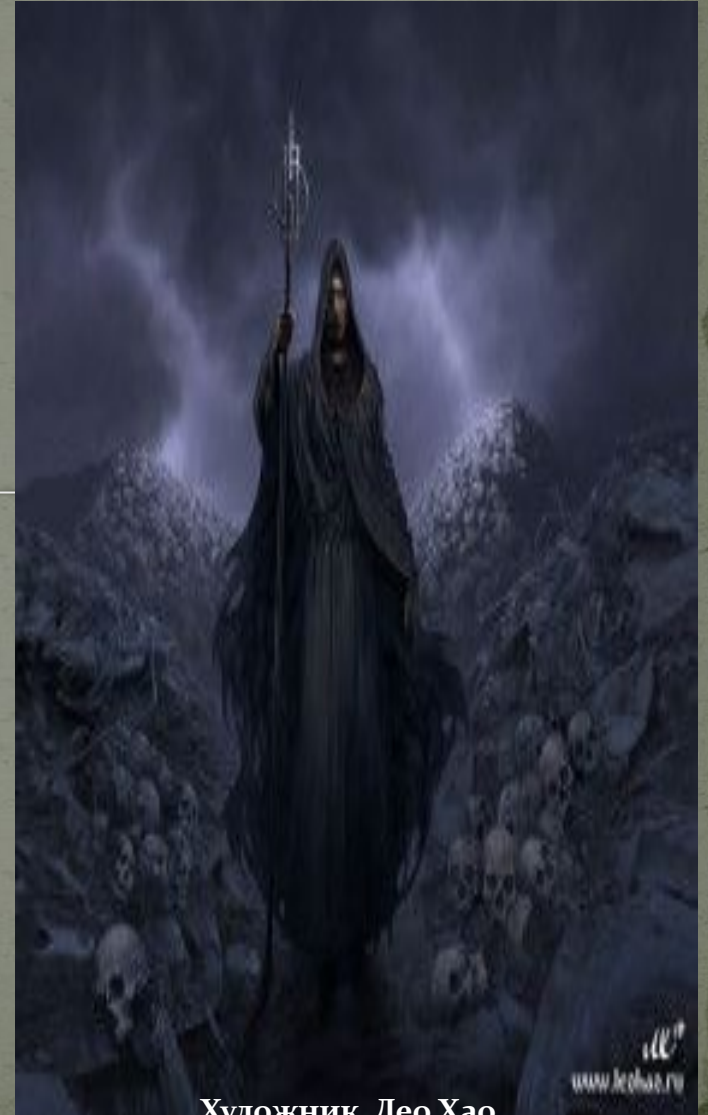
Художник Лео Хао