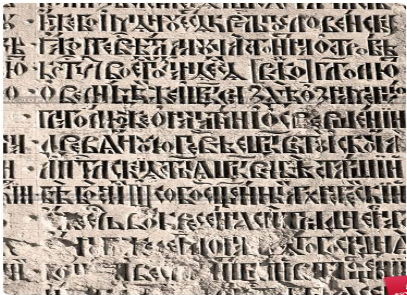
Истра. Надпись на старославянском языке на стене голгофского придела Ново...