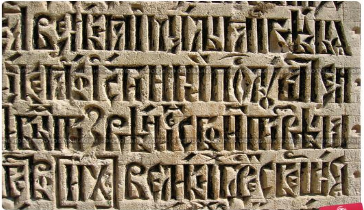
Рельефная надпись на церковнославянском языке (Новый Иерусалим, Москва)

Церковнославянский язык с самого начала являлся (и до сих пор является) языком православного богослужения; долгое время он занимал доминирующее положение в письменной сфере в целом.