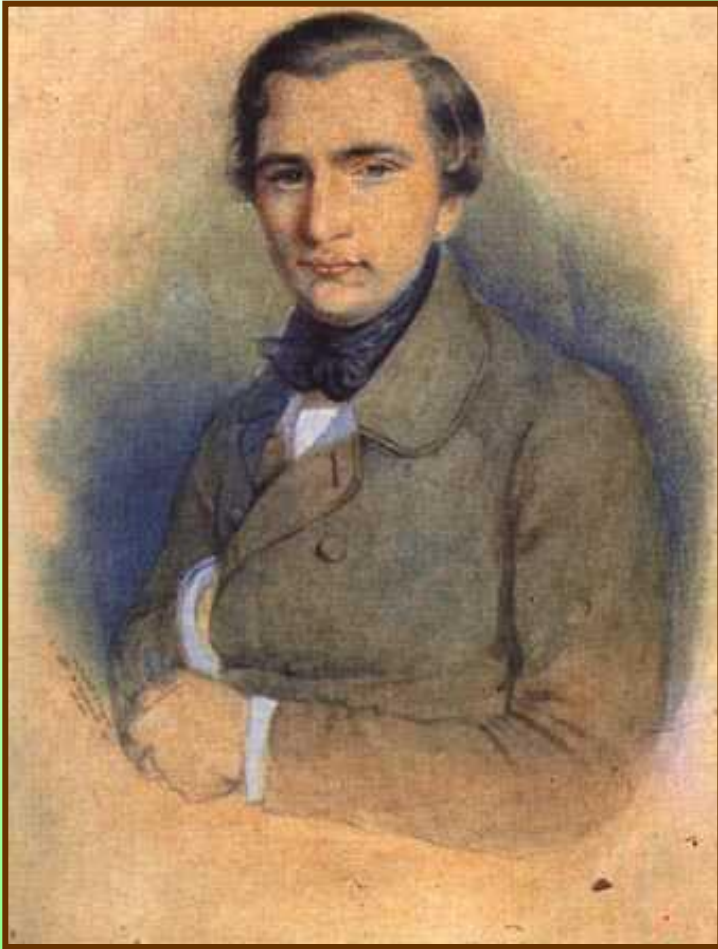
Тургенев в возрасте 20 лет. 1838 год

В 1836 г. Тургенев окончил курс со степенью действительного студента. Мечтая о научной деятельности, он в следующем году снова держал выпускной экзамен, получил степень кандидата, а в 1838 г. отправился в Германию. Поселившись в Берлине, Тургенев усердно взялся за занятия.