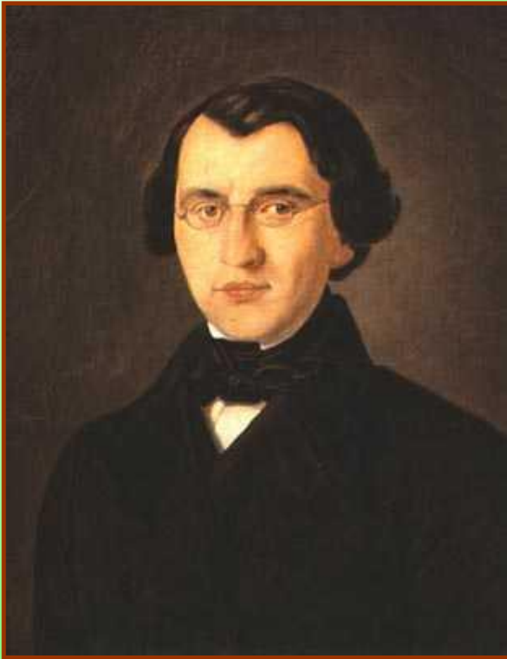
Тургенев в возрасте 26 лет. 1844 год