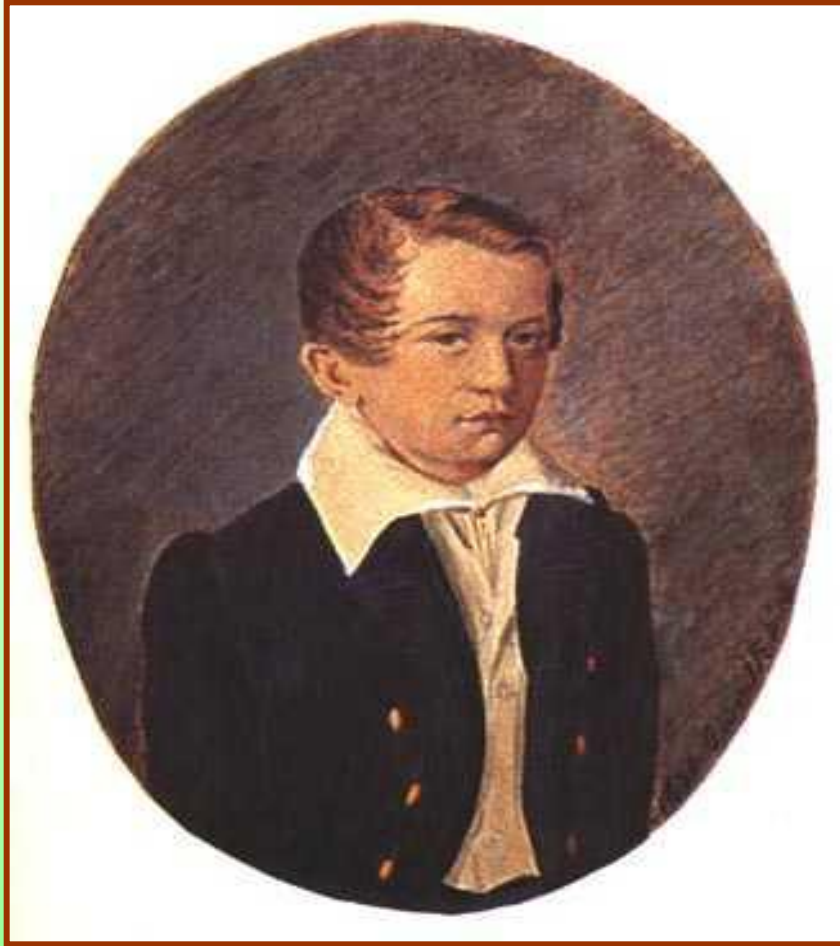
Тургенев в возрасте 12 лет. 1830 год

В 1833 г. 15-летний Тургенев (такой возраст студентов, при тогдашних невысоких требованиях, был явлением обычным) поступил на словесный факультет Московского университета. Год спустя, из-за поступившего в гвардейскую артиллерию старшего брата, семья переехала в Санкт-Петербург, и Тургенев тогда же перешел в Петербургский университет