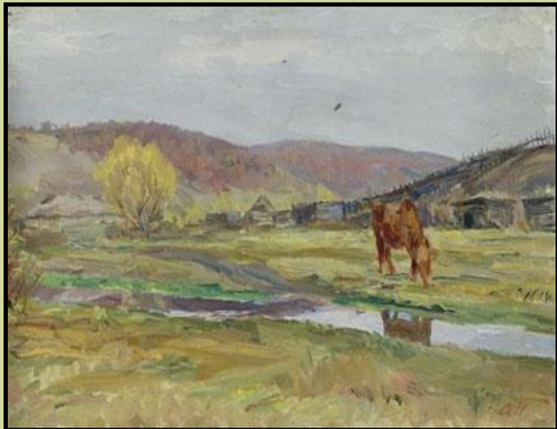
«Конь в поле»