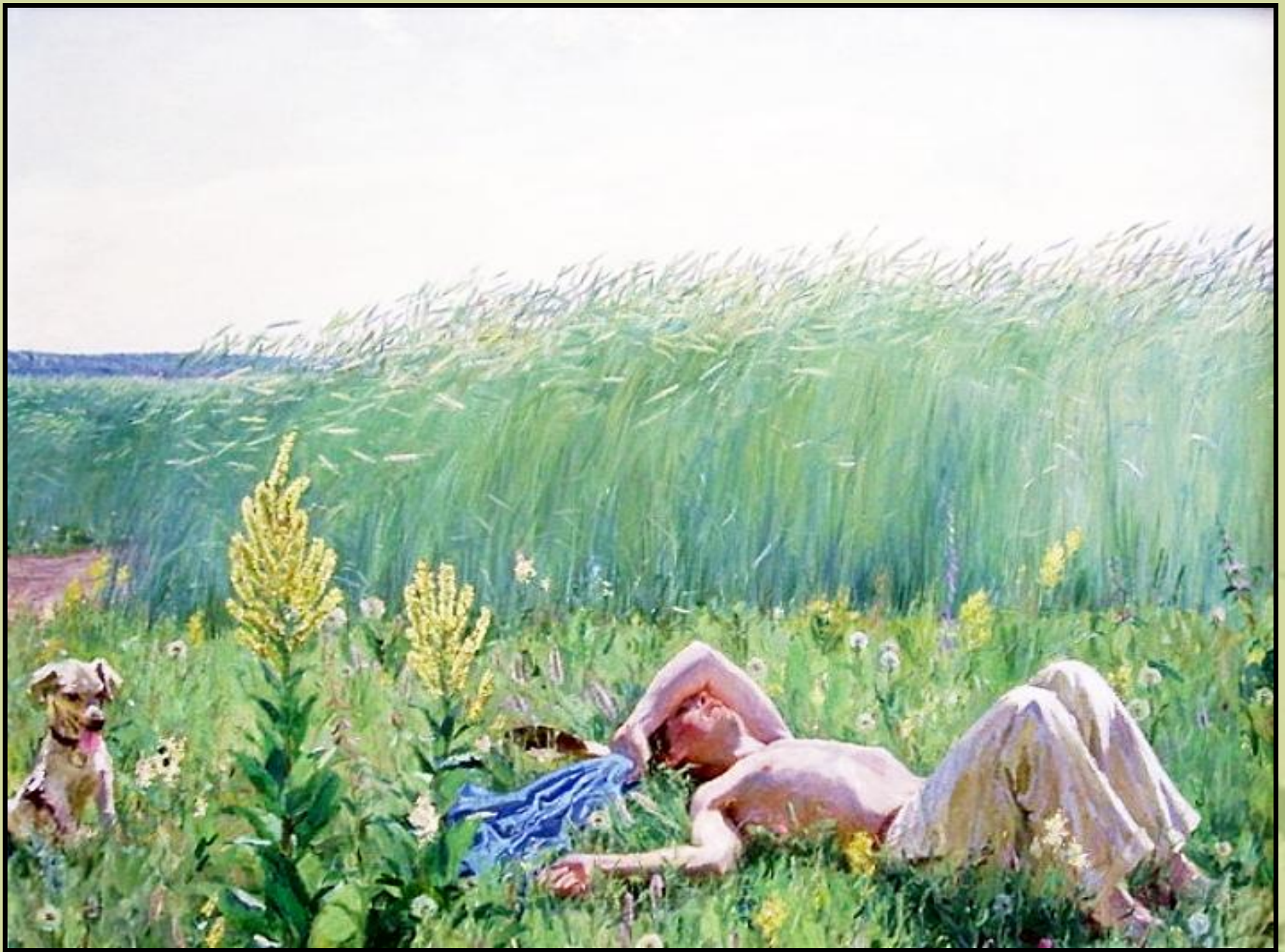
« Юность »