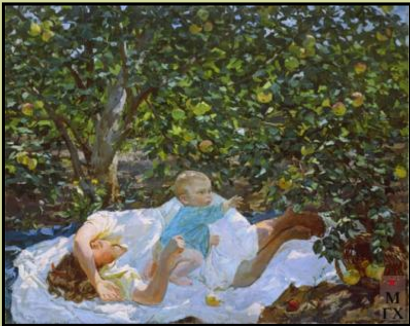
«Когда на земле мир»