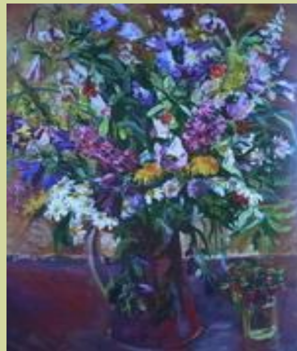
«Цветы и земляника»