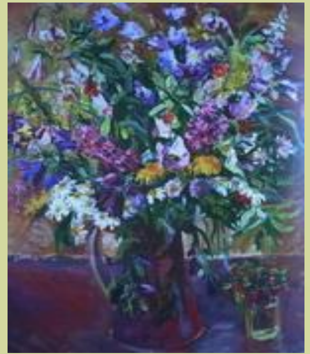
«Цветы и земляника»