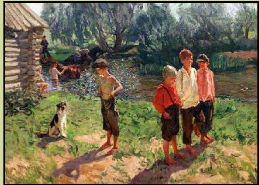
«Тройка. Ребятишки у ручья»