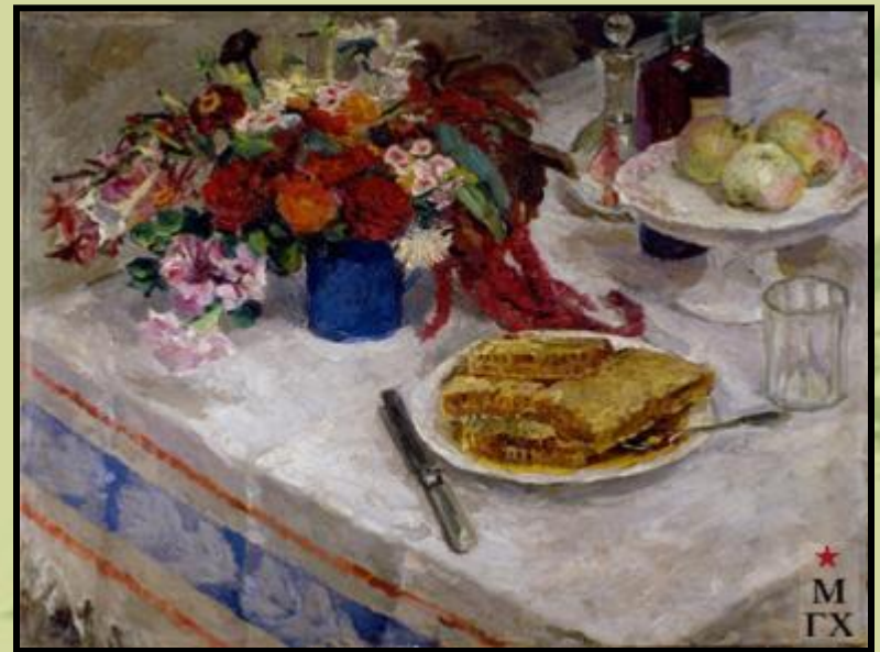
«Цветы и мёд»