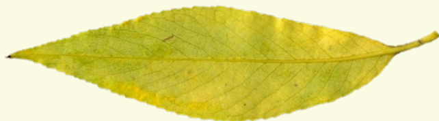
Лист ивы ( тонкие золотые рыбки)