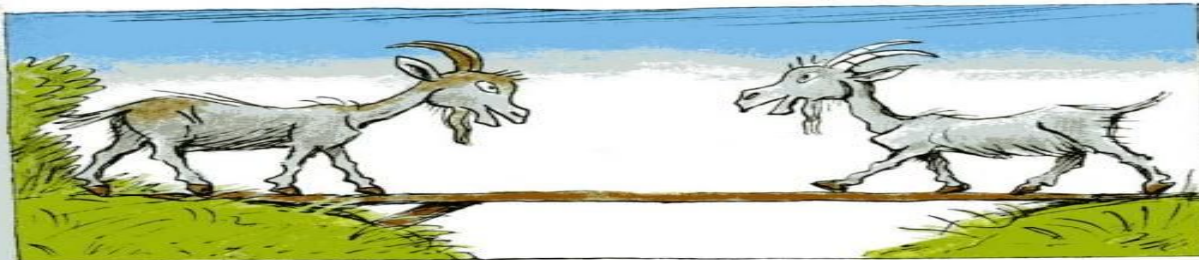
Два упрямых козлика