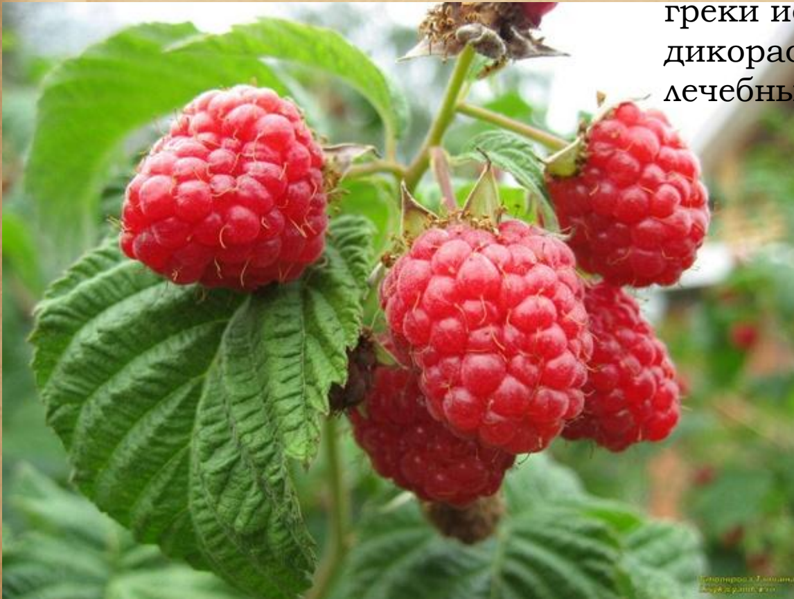
Иллюстрация: Малина А.А. Давыдов

Общеславянское слово; как растение малина известна с каменного века, ещё 2 тысячи лет назад римляне и греки использовали дикорастущую малину в лечебных целях.