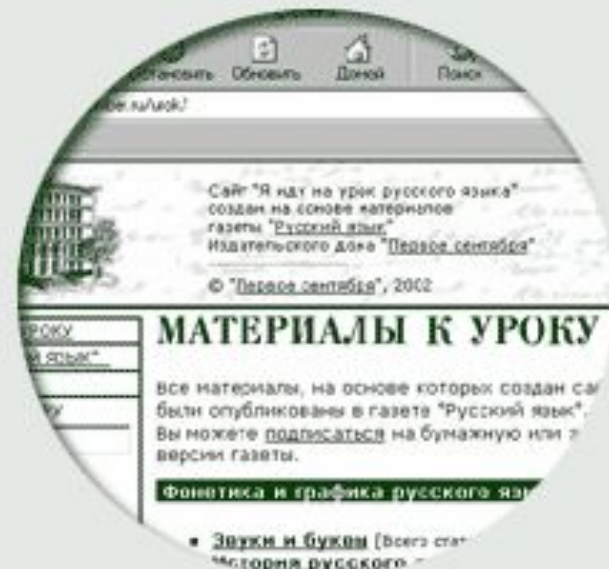
Сайт для учителей «Я иду на урок русского языка»