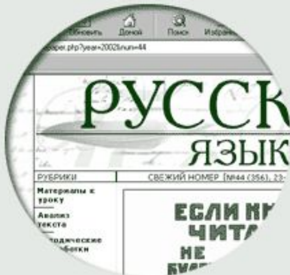
Электронная версия газеты «Русский язык»